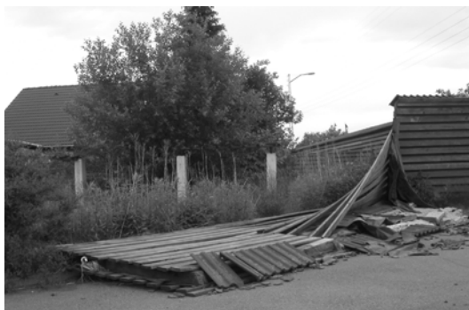
Det væltede hegn på Jerslev Allé